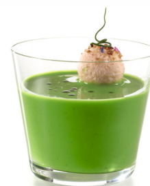
Brokkolisuppe aus Strünken ist ein Beispiel für Mehrwert made by Pacojet.