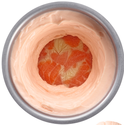
Teige & Massen