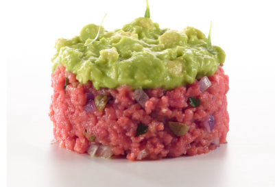
Frisch zubereitetes Tatar mit Guacamole